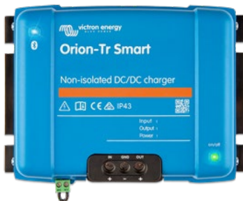
Orion-Tr Smart, nicht isoliert 12/12-30