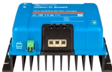
Orion-Tr Smart, nicht isoliert 12/12-30