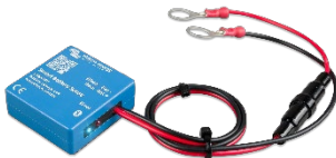
Bluetooth-Erkennung: Smart Battery Sense