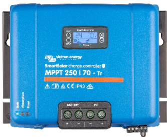
SmartSolar-Laderegler MPPT 250/70-Tr mit optionalem einsteckbarem Display