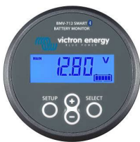
Bluetooth-Erkennung: BMV-712 Smart Battery Monitor